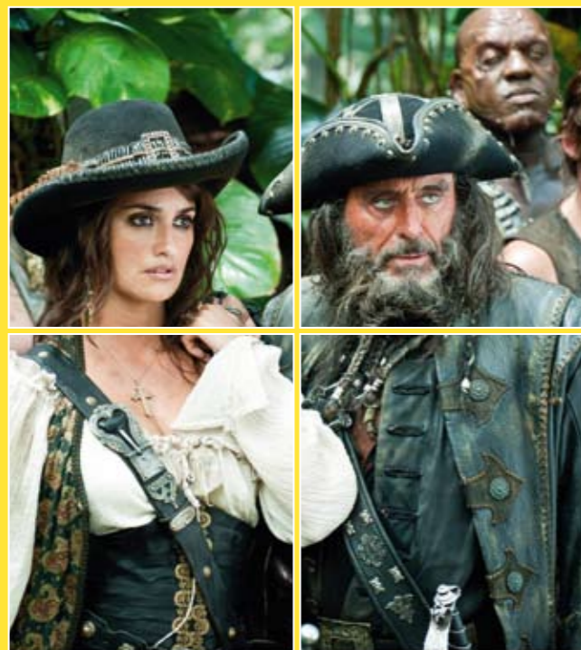
Piratas del Caribe: Navegando aguas misteriosas / Pirates of the Caribbean: On Stranger Tides